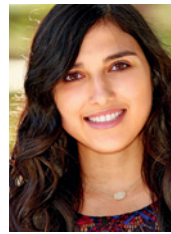
Alba aus Spanien

a In Deutschland darf man nicht einfach seine Freunde zu einer Einladung mitbringen. Das überrascht (raschtüber) mich. In Brasilien nimmt man oft jemanden mit. Aber meistens fragt man ..... (hervor).