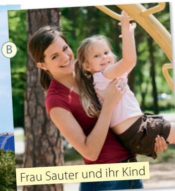
Frau Sauter und ihr Kind