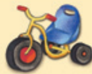
das Dreirad እታ ሰለስተ እግራ ቐግሊታ