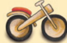
das Laufrad እታ ትድፋእ ቐግሊታ