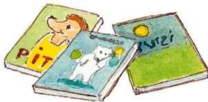
die Bücher (pl.) τα βιβλία