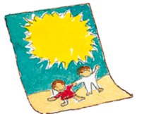
das Poster η αφίσα