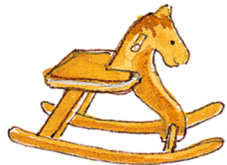
das Schaukelpferd το κουνιστό αλογάκι