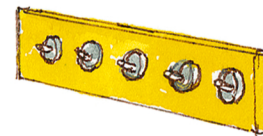
die Garderobe η κρεμάστρα