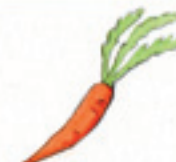
die Karotte морковь