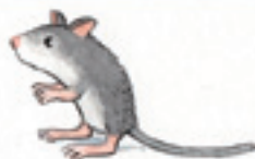
die Wüstenrennmaus мышь песчанка