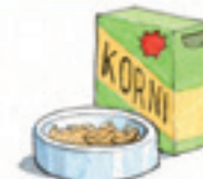
das Körnerfutter зерно