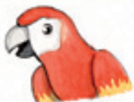
der Papagei попугай